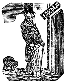
EL DOTOR CUDOL