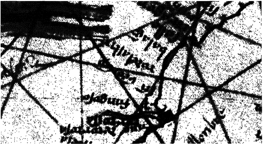
Fragment de l'atles de Pietro Vesconte, [1318], amb el topònim rodebaastro

Si la lectura de la Carta pisana fos satisfactòria, no hauríem d'arrencar del venecià Pietro Vesconte (1318, 1321), el gran productor d'atles, que dóna clarament rodelaastro , que retrobem a la carta d'Angelinus Dulcetus de 1330 ca. Angelinus Dulcetur (1325 ca i 1339), ja anostrat, ens forneix la grafia transitòria rodolaster o rodelaster , des de la qual hom passa fàcilment a rodelaastre o rodolastre (atles anònim venecià, 1390; atlas Tamar Luxoro, 1400 ca; anònim ricardià, segles XIV-XV) que, si no implica enteniment del concepte, almenys s'acosta a l'etimologia.