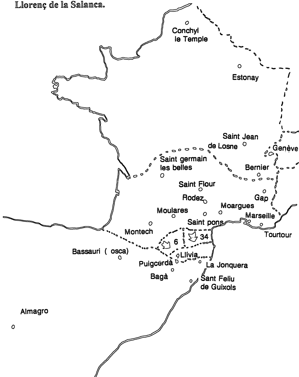
Mapa 4: procedències del reiame de França i del Principat a St-Llorenç de la Salanca.