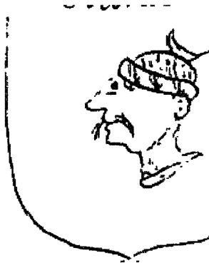
El cap d'un musulmà a l'escut de Morlà. BNM, ms 4068.

Observem, de pas, el joc de paraules entre el cognom i les paraules del rei: "Mort lo ha ...". El manuscrit de la BUV directament escriu " Morlà com un cid ".